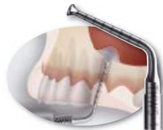
Sinusbodenelevation durch hydrodynamischen Kavitationseffekt

Der Vorteil für Ihre Patienten: Intralift ist die sicherste und schonendste Methode für den internen Sinuslift. Der Vorteil für Sie als Zahnarzt: Sie arbeiten kostengünstig, auf neuestem Stand der Technik und mit höchster Sicherheit. Denn mit den fünf TKW-Ansätzen für Piezotome und ImplantCenter können Sie die Schnitttiefe präzise kontrollieren. Das Ergebnis überzeugt: Ihre Patienten haben deutlich weniger postoperative Schmerzen und Schwellungen.